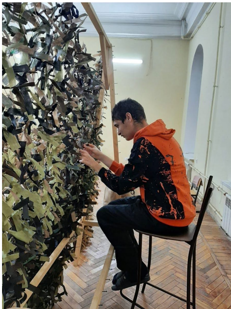
На изготовление одной сети для СВО уходит от 6 часов

В волонтерском центре парень сразу же принимается за работу, изредка отвлекаясь лишь на указания мамы. Дело спорится.